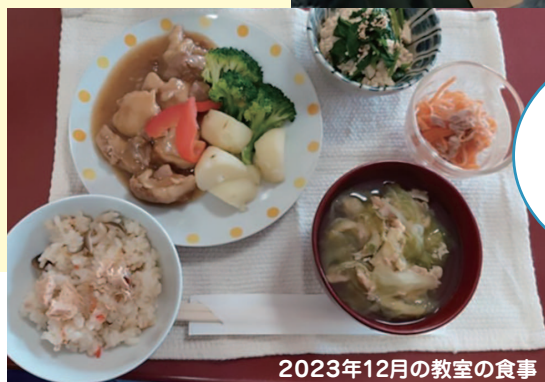
2023年12月の教室の食事